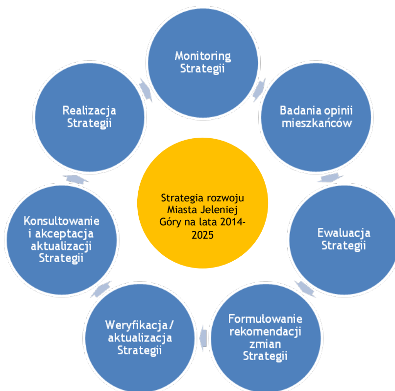
Schemat 2. Cykl zarządzania Strategią

Opracowanie: Jacek Dębczyński, Grzegorz Romańczuk