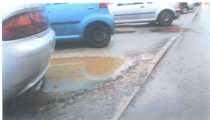
Kaluze uniemożliwiają wyjście z samochodu