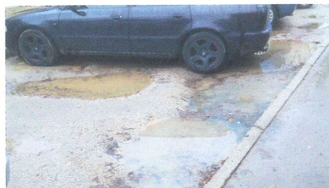
Niektóre są tak głębokie, że krawężnik chrobcze o podwozie przy wjeżdżaniu