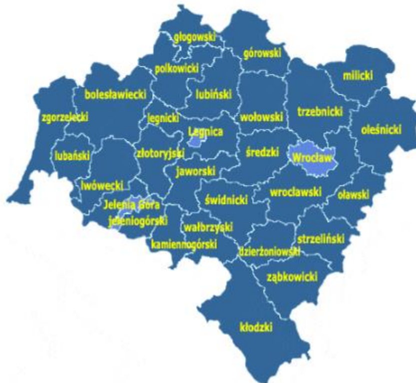
Rysunek 1. Położenie miasta na tle województwa dolnośląskiego

Jelenia Góra położona jest w południowo-zachodniej części Polski w centrum śródgórskiej kotliny na wysokości od 330 do 370 m n.p.m. Od zachodu otaczają miasto Góry Izerskie, od północy Góry Kaczawskie, od wschodu Rudawy Janowickie, a od południa najwyższe pasmo Sudetów – Karkonosze z najwyższym szczytem Śnieżką. Przez teren Miasta przepływają rzeki: Bóbr, Kamienna, Wrzosówka i Pijawnik. Powierzchnia Miasta wynosi 108,4 km 2 , a zamieszkuje ją ponad 80 tys. mieszkańców. Miasto Jelenia-Góra jest siedzibą władz miejskich, władz powiatu oraz ważnym centrum przemysłowo-turystycznym regionu.