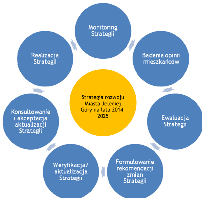
Schemat 2. Cykl zarządzania Strategią

Opracowanie: Jacek Dębczyński, Grzegorz Romańczuk