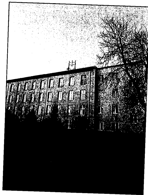
Rys. 4 Widok badanego obiektu