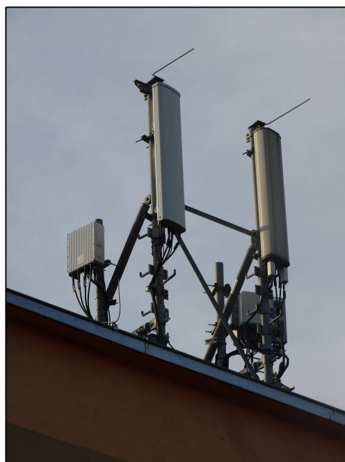
Rys. 3 Widok badanego obiektu