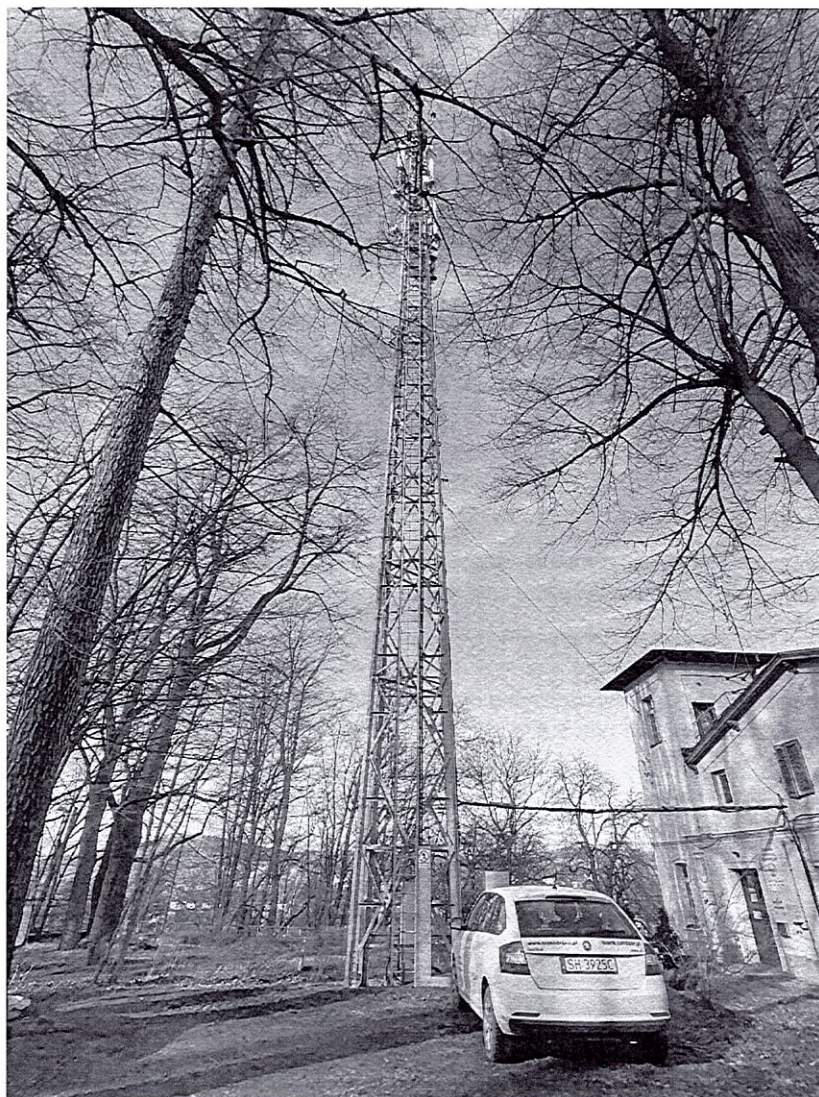
Zdjęcie 1 Badany obiekt