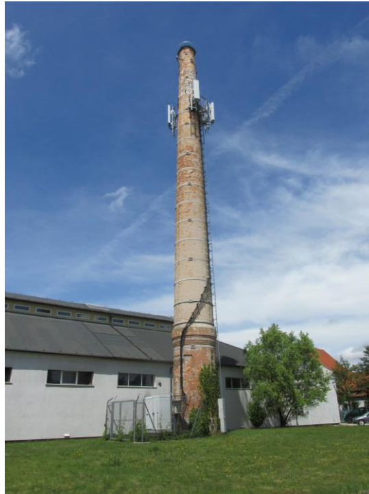
Zaf. nr 1: Widok ogólny instalacji radiokomunikacyjnej.