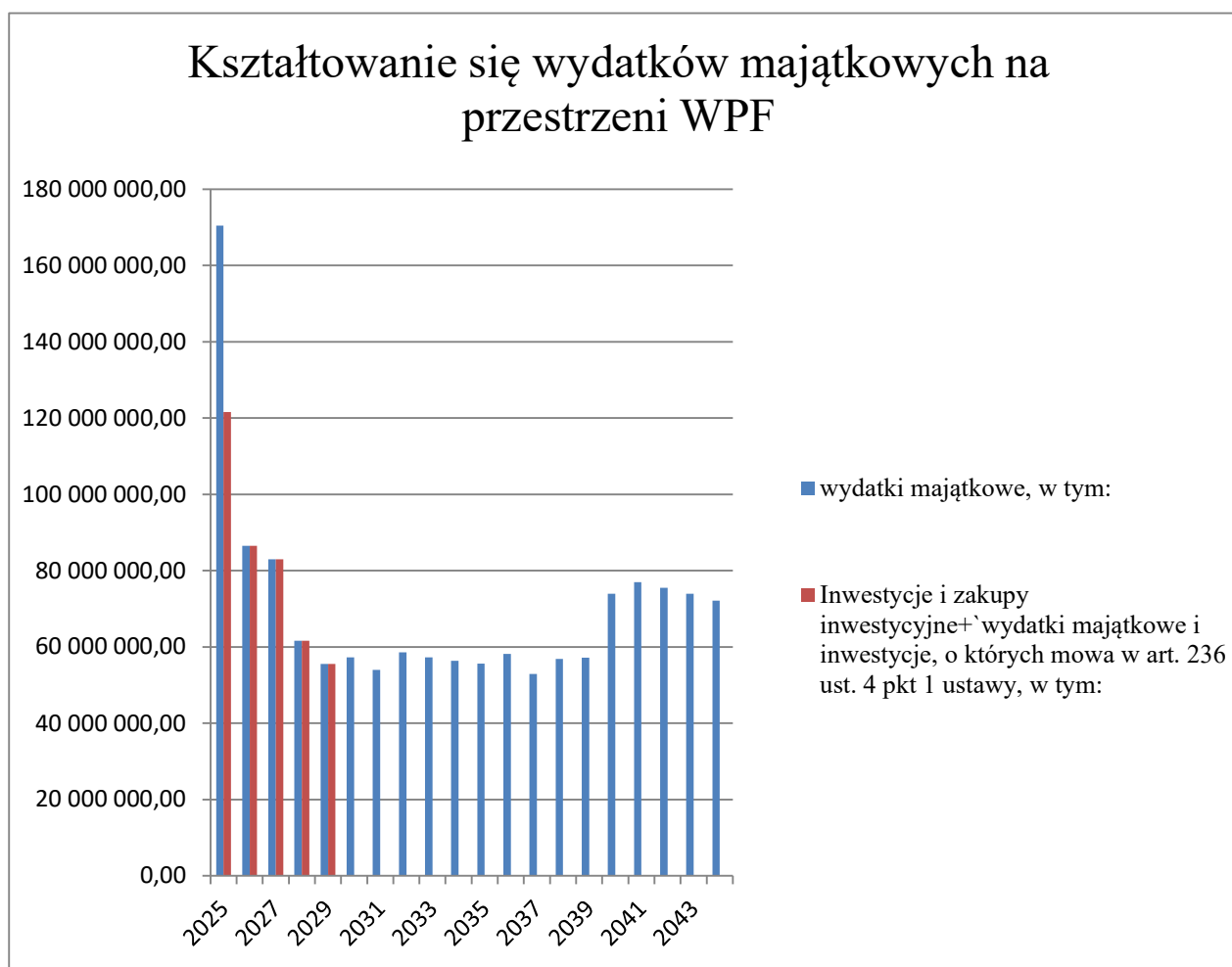
TABELA nr 2

Niewykorzystane środki pieniężne, o których mowa w art. 217 ust. 2 pkt. 8 ustawy o finansach publicznych, przeznaczone na wydatki bieżące w 2025 roku