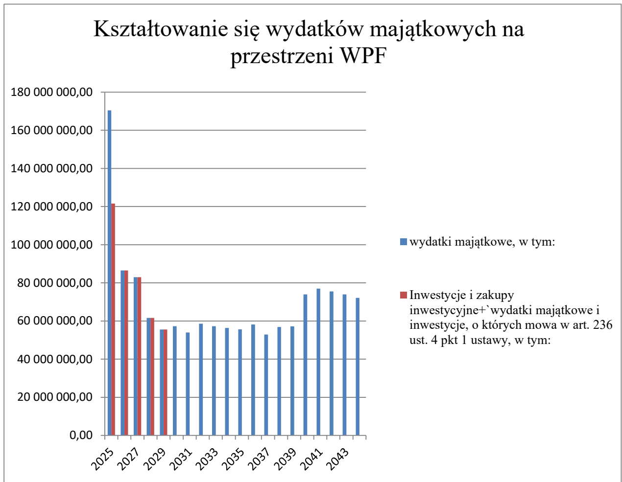
TABELA nr 2

Niewykorzystane środki pieniężne, o których mowa w art. 217 ust. 2 pkt. 8 ustawy o finansach publicznych, przeznaczone na wydatki bieżące w 2025 roku